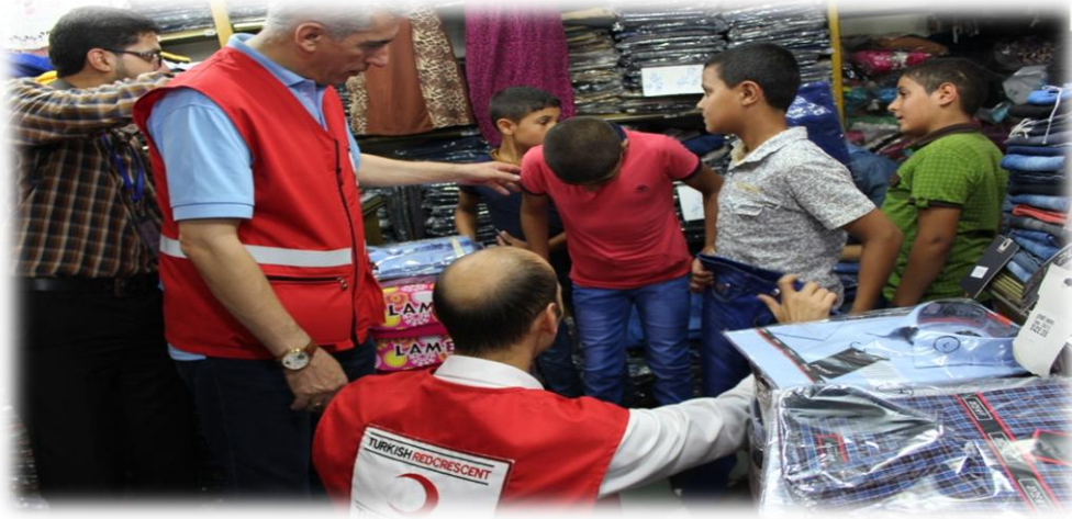
صورة توضيحية للأبناء أثناء شراء الكسوة

مشروع الكسوة الممول من الهلال الأحمر التركي، بقيمة 45 ألف دولار، والذي وفر الدفء والحنان للأيتام في ظل الظروف الصعبة التي يمر بها قطاع غزة، حيث استهدف المشروع ما يقارب مئة يتيم داخل المعهد، ووفر لهم احتياجاتهم من الملابس من خلال توفير كسوة صيفية وشتوية و كسوة المدارس، بالإضافة لكسوتي العيدين.