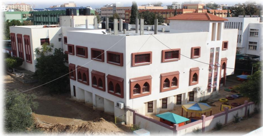
صورة توضيحية لمبنى الروضة

تم تنفيذ مشروع إضافة طابق جديد لروضة ياهلا بمساحة 261م 2 ، والذي عمل على زيادة أعداد الأطفال المنتسبين للروضة إلى ما يقارب 270 طفل جديد، وإفتتاح ثلاث فصول دراسية جديدة وصالة رياضية، وذلك بتمويل ذاتي من المعهد.