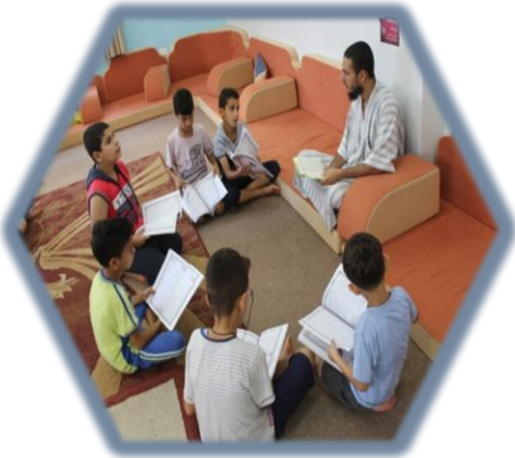
تحفيظ القرآن الكريه