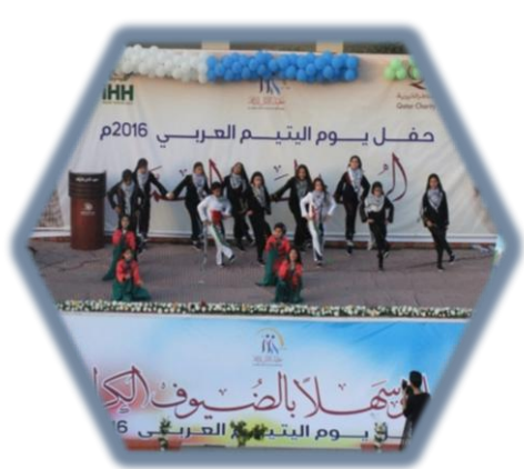
محل يوم اليتيم