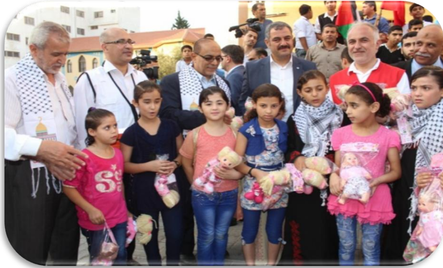
وفد الهلال الأحمر التركي