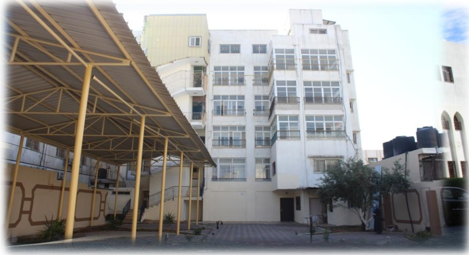
صورة توضيحية لمركز الأمل لخدمة المجتمع