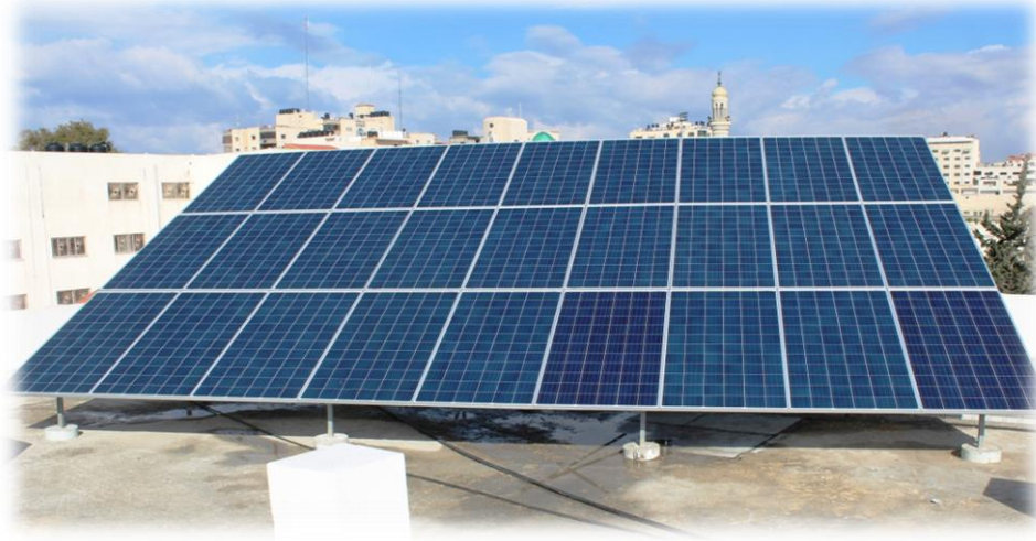
صورة توضيحية للخلايا الشمسية

هدف هذا المشروع الممول من مؤسسة مساعدات فلسطين - بريطانيا بقيمة (17) ألف دولار، لتوليد الكهرباء باستخدام الطاقة الشمسية وإضافة القدرة المطلوبة بشكل ملح للمعهد ولمساعدته على مواكبة النمو المتواصل، وللتخفيف من مشكلة نقص الكهرباء في قطاع غزة، والحد من مشكلة تشغيل المولدات الكهربائية بشكل كبير والتي تستنزف كميات كبيرة من المحروقات، وفي مرحلته الأولى يزود المشروع فعلياً مبنى الإدارة وأقسام الإيواء بالطاقة الكهربائية.