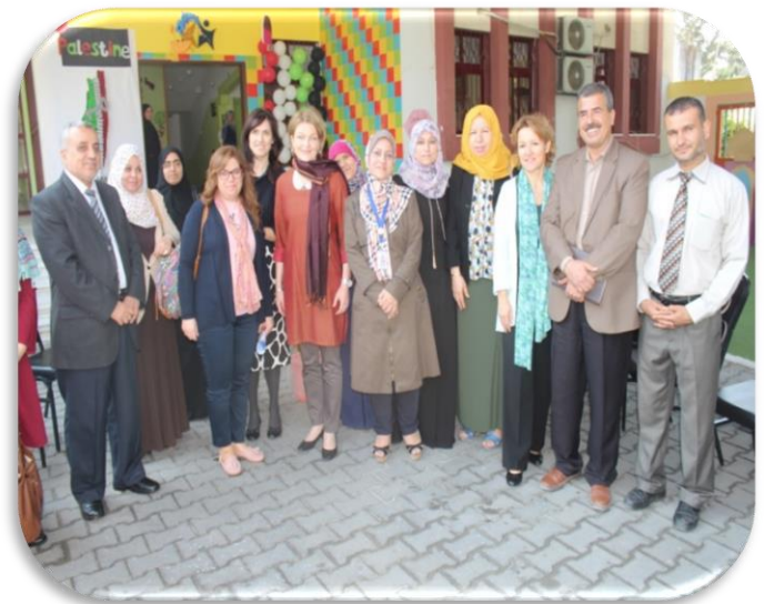
زيارة وفد السفارة الفنلندية