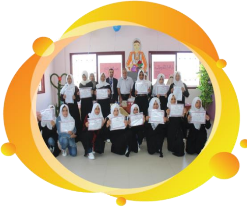
تحفيظ قرآن كريم