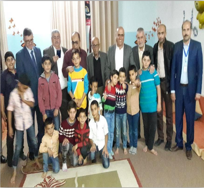
زيارة اللواء أكرم الرجوب