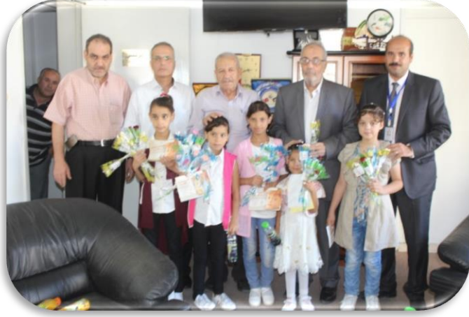
زيارة الغرفة التجارية