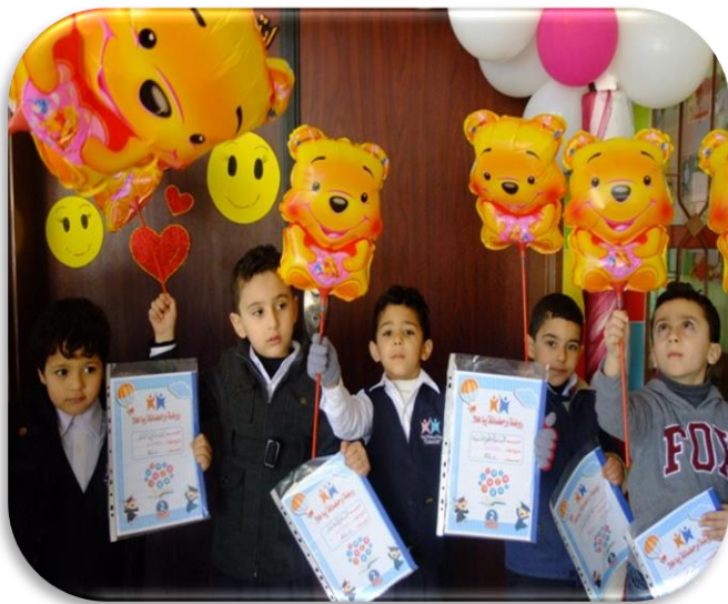
حفل استقبال الأطفال