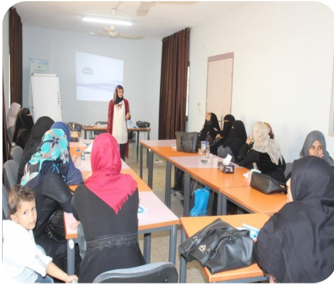
دورة حقوق الأمل الفلسطينيات