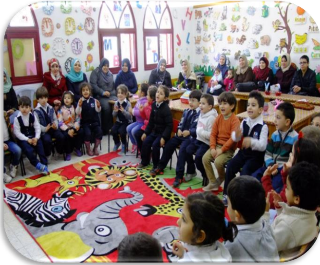
دروس نموذجية باللغة الإنجليزية