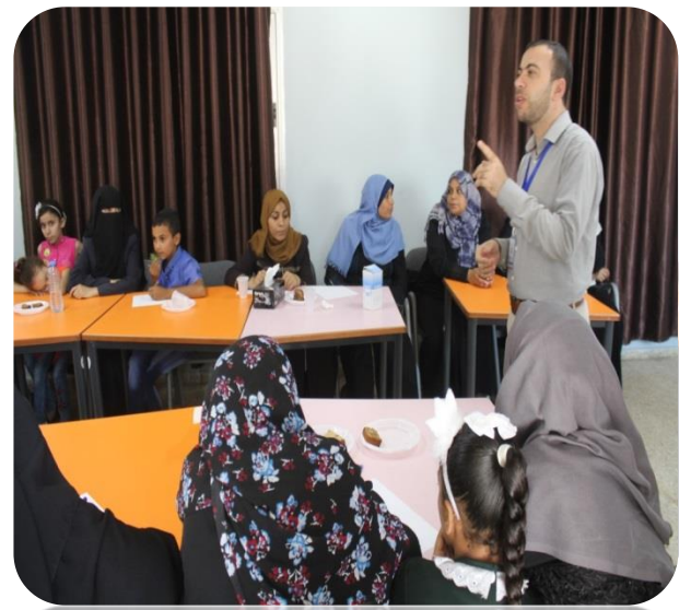
دورة الاحتياجات النفسية لأمهات الأيتام