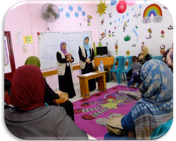
ندوات تثقيفية لأهالي الأطفال