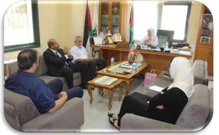
زيارة جمعية الحق في الحياة