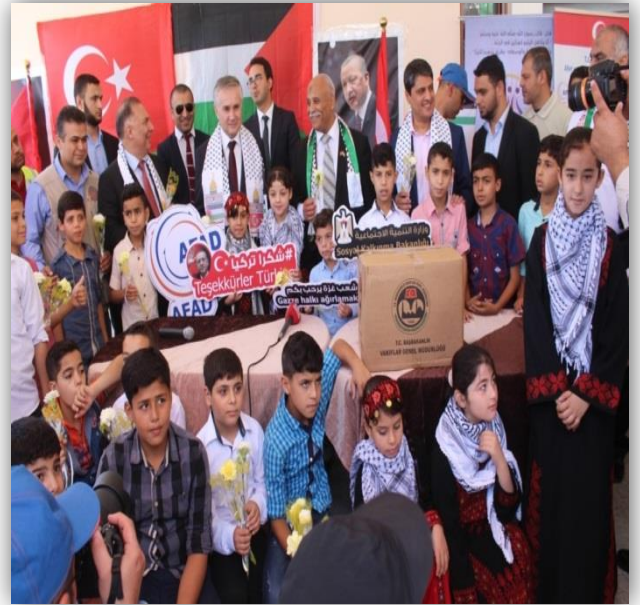
زيارة الوفد التركي