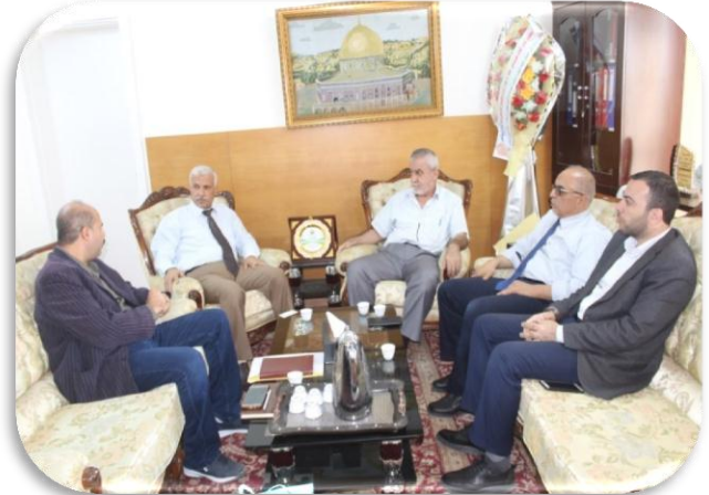
زيارة اللجنة القطرية