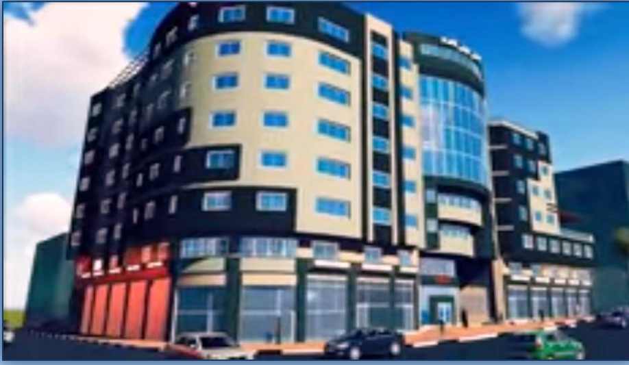
صورة توضيحية لمبنى نابلس