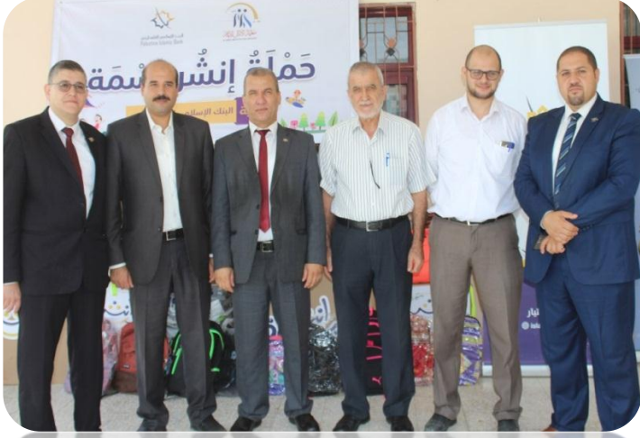
زيارة البنك الإسلامي الفلسطيني