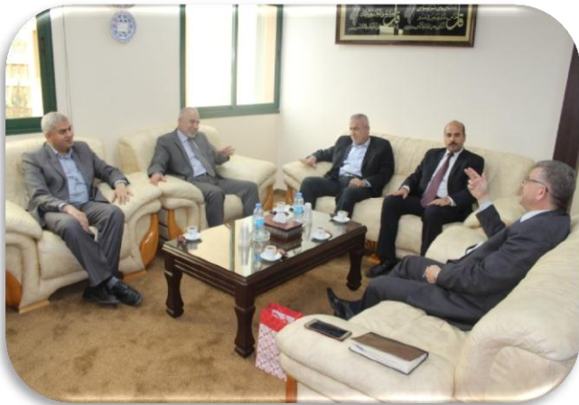
زيارة الجامعة الإسلامية